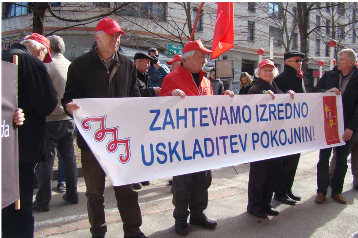
ZSSS in njen sindikat upokojenecv sta večkrat zahtevala izredno uskladitev pokojnin

Obdobje po 6. kongresu ZSSS decembra 2012 je na področju pokojninskega zavarovanja prav gotovo opredeljevala tudi uveljavitev ZPIZ-2 1. 1. 2013. Zaradi naglice pri njegovem sprejemanju je njegovo izvajanje pokazalo vrsto nesprejemljivih napak. ZSSS je izvedla akcije zlasti pri naslednjem: