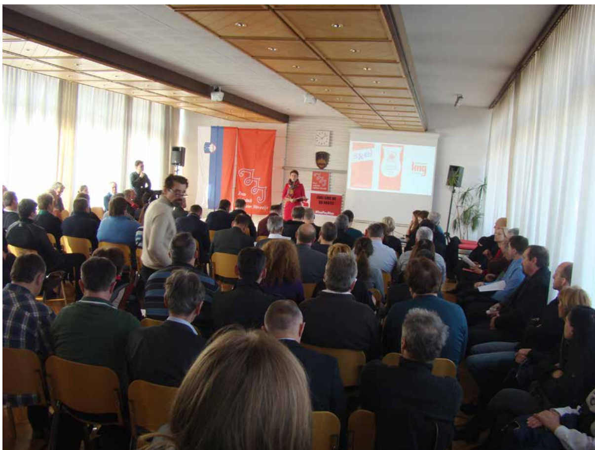
Sindikati zasebnega sektorja v okviru ZSSS so organizirali konferenco o aktivnostih za zvišanje plač

Zaradi velikega nezadovoljstva članov in zaposlenih s plačami smo zato v februarju 2017 na pobudo sindikatov, članov ZSSS zasebnega sektorja podali enotno zahtevo delodajalskim organizacijam, da se najnižja osnovna plača za prvi tarifni razred (najenostavnejše delo) določi v višini minimalne plače. Na ta način bi minimalna plača postala plačno dno, kar je njen glavni namen. Delodajalce smo pozvali k postavitvi novega plačnega modela, ki bo zneske iz kolektivnih pogodb prilagodil dejanskim izplačilom v praksi in ki bo postavil realno ceno dela po posameznih delovnih mestih in poklicih. Sedaj namreč zneski, zapisani v tarifnih delih kolektivnih pogodb dejavnosti, ne odražajo dejanskih izplačil plač delavcev; v velikem številu kolektivnih pogodb pa se tudi delavci, ki zasedajo delovna mesta, za katera se zahteva višja stopnja izobrazbe (VI. tarifni razred), uvrščajo pod minimalno plačo, kar pomeni, da jim mora delodajalec v primeru, ko vsota vseh sestavin plače ne doseže zakonskega zneska minimalne plače, še doplačati razliko do tega zneska. Zaradi sedaj veljavnega plačnega modela je v sistem vključena tudi anomalija, ki se izraža v nizkem fiksnem delu plač delavcev in visokem variabilnem delu, kar pa po drugi strani ne velja za menedžerje, katerih plačilo bi dejansko moralo biti v največji meri vezano na uspešnost družb, ki jih vodijo.