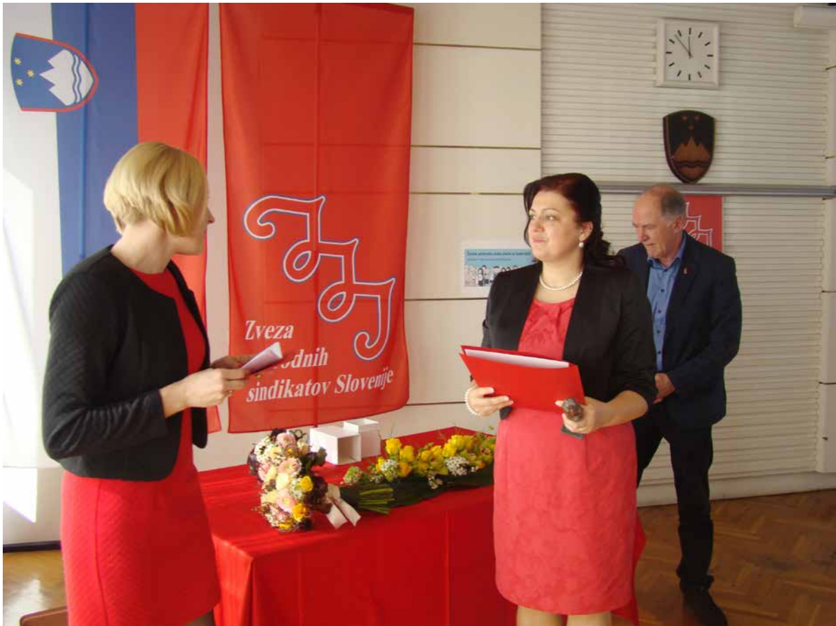
ZSSS vsako leto podeljuje tudi najvišje priznanje na področju enakih možnosti – rožo mogoto

Vse od leta 2006 odbor za enake možnosti podeljuje priznanje roža mogota za dosežek leta na področju uveljavljanja enakih možnosti žensk in moških na trgu dela in v družbi kot celoti. Podelitev tradicionalno poteka na 8. marec, mednarodni dan žensk, in pomeni učinkovito javno kampanjo za povečanje znanj in dviganje ozaveščenosti o pomembnosti zagotavljanja enakih možnosti žensk in moških na vseh področjih človekovega življenja. Skozi leta je priznanje pridobilo pri prepoznavnosti in ugledu ter obenem ohranilo aktualnost, saj vsako leto pritegne pozornost ne le sindikalnih organizacij, temveč tudi širše javnosti. Prejemnice so bile izbrane na podlagi vsakoletnih razpisov, k predlaganju kandidatke in kandidatov pa je povabljen vsa članstva.