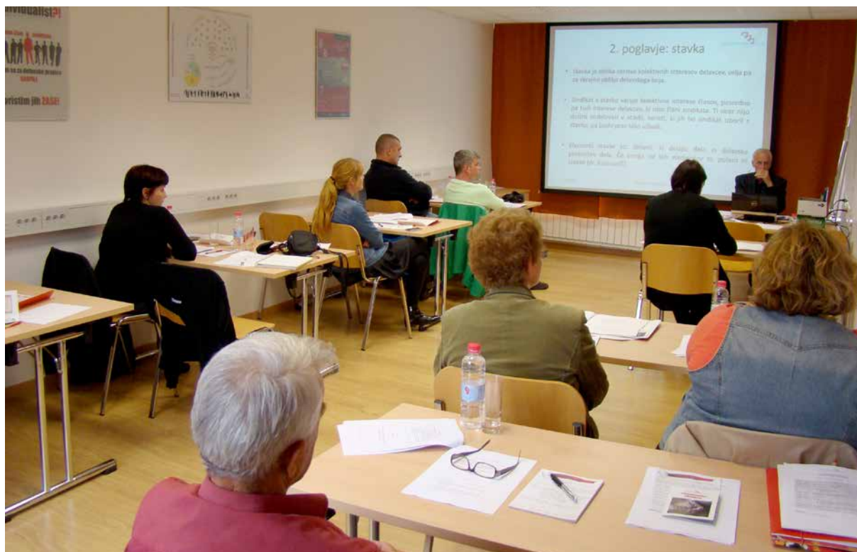
V okviru Sindikalne akademije ZSSS smo organizirali številne seminarje z različnih področij sindikalnega dela

Sindikalna akademija je bila zasnovana v letu 2013. Seminarje smo pričeli izvajati januarja 2014. Vsako leto je bilo razpisanih med 20 in 30 seminarjev. Nekatere teme so bile razpisane večkrat na različnih lokacijah. Večina seminarjev je bilo z nivoja mala sindikalna akademija. V drugi polovici leta 2015 smo pričeli razpisovati tudi seminarje z nivoja srednja sindikalna akademija. Seminarje višje sindikalne akademije smo pričeli izvajati v letu 2017. Vsako leto je nekaj razpisanih seminarjev tudi odpadlo. Večinoma so bili razlog bolezni predavateljev, premajhno število prijav ali preobilica dela sindikalne stroke. Vsi člani sindikata, ki so se udeležili seminarjev, imajo to zabeleženo v centralni evidenci članstva. Prav tako so vsi dobili beležnice sindikalnega znanja – Sindeks. Po vsakem seminarju udeleženci prejmejo potrdilo o udeležbi ter evalvacijske vprašalnike. Vprašalniki so vsakokrat pregledani in statistično obdelani. Seminarji so ocenjeni kot zelo dobro pripravljene in izvedeni, kar pomeni, da udeleženci seminarjev dobijo kvalitetno pripravljene vsebine in gradiva. Velikokrat udeleženci pohvalijo sindikalno akademijo in si želijo še več vsebin ter izvedb seminarjev.