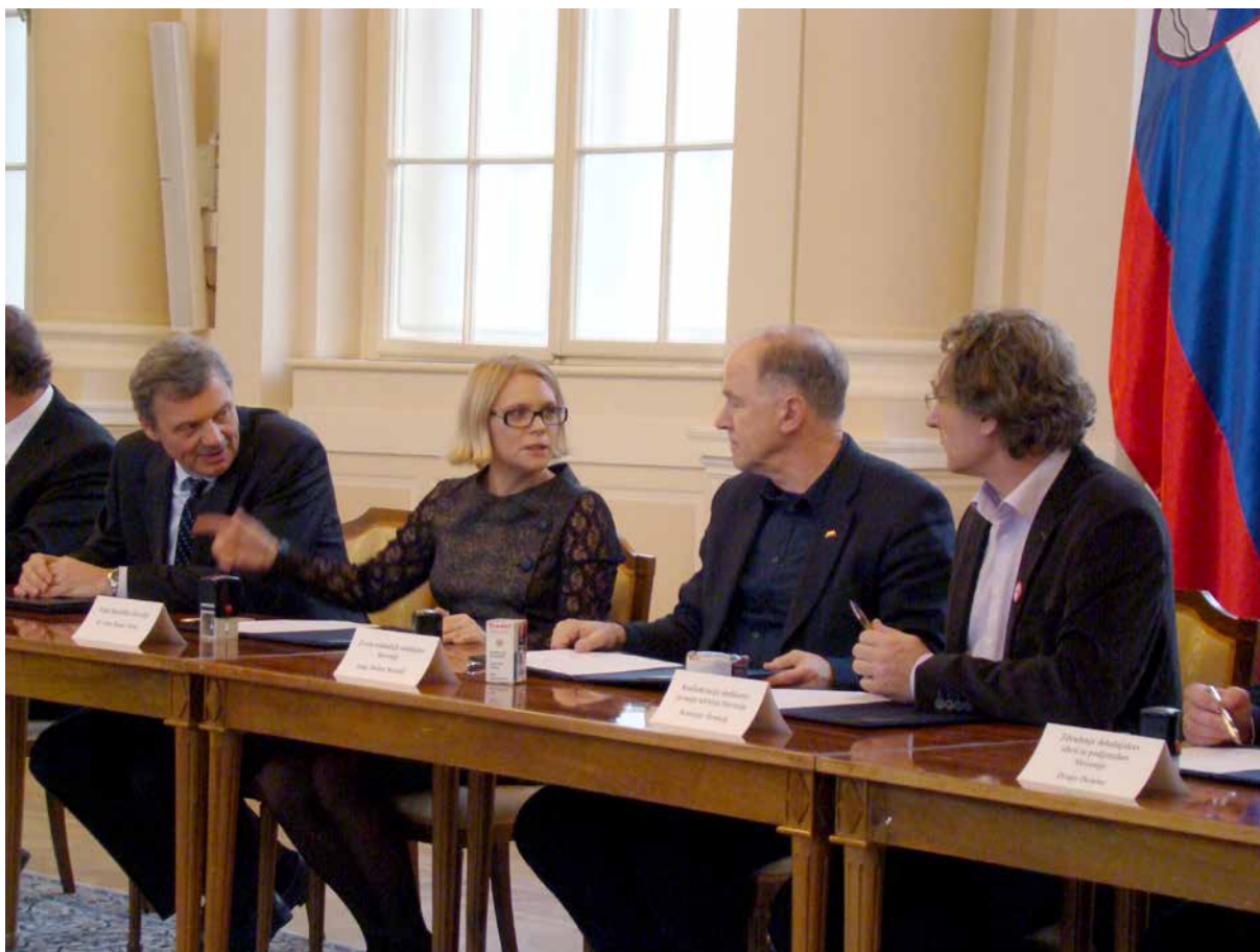
Podpis socialnega sporazuma februarja 2015

Vlada je z namenom centralizacije upravljanja državnega premoženja ustanovila Slovenski državni holding (SDH), glede katerega smo bili v ZSSS zelo kritični že od samega začetka. Opozarjali smo na neustrezno razporeditev podjetij med portfeljske, pomembne in strateške v okviru klasifikacije naložb, nadzorstveno funkcijo v holdingu in preveliko pristojnost vlade. Vztrajali smo pri stališču, da je potrebno klasifikacijo potrditi v državnem zboru in da o tem ne more odločati vlada ali zgolj družba, ki je bila ustanovljena za upravljanje naložb. Opozarjali smo, da prodaja najboljših slovenskih podjetij vodi v popolno odvisnost, prav tako pa je popolnoma neracionalno prodajati družbe, ki dobro poslujejo in veliko prispevajo v javnofinančne blagajne tako iz naslova davka na dobiček kot preko vplačil dohodnine in prispevkov za socialno varnost. Zahtevali smo, da se v organe nadzora SDH vključijo tudi predstavniki zaposlenih. Nasprotovali smo zahtevam vlade, da se 34,47-ostotni delež v Zavarovalnici Triglav prenese na SDH. Zahtevali smo, da je kot eden največjih lastnikov v nadzornem svetu zavarovalnice tudi predstavnik upokojujencev. Prepričani smo, da bi morali delež Zavarovalnice Triglav, ki je po referendumski odločitvi v lasti ZPIZ, prenesti na demografski sklad. Opozarjali smo, da bi lahko predlog zakona o SDH omogočal nesmotrno gospodarjenje ter odtujevanje državnega premoženja.