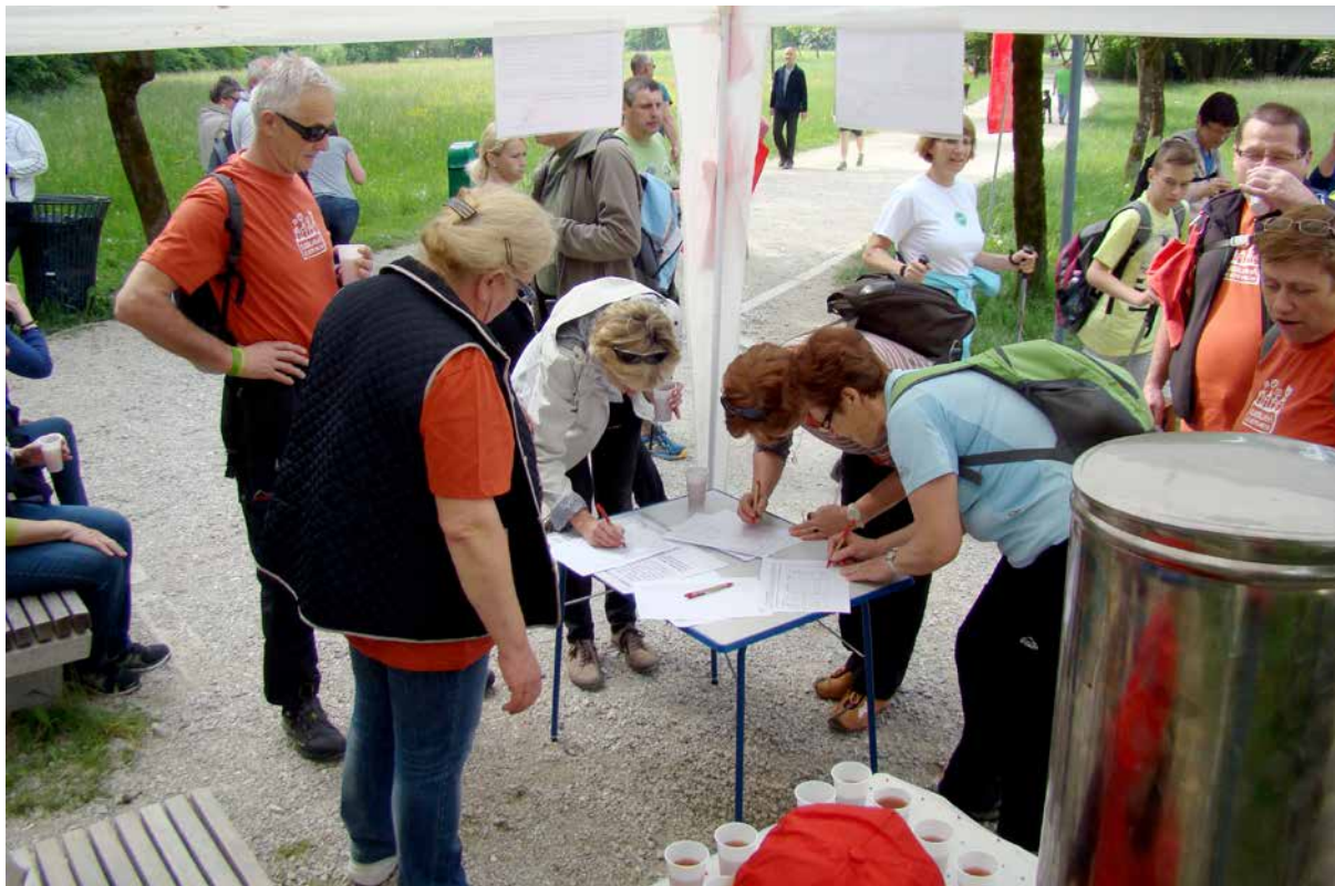
Zaposleni v ZSSS vsako leto postavijo stojnico ob trasi pohoda ob žici v Ljubljani in delijo pohodnikom čaj, če je potrebno, pa zbirajo tudi podpise

februarja manifestacijo pred Prešernovim spomenikom v Ljubljani, kjer znani slovenski igralci recitirajo različne pesmi, mimoidočim pa sindikat deli fige. Tradicionalna je vsakoletna počastitev mednarodnega dne človekovih pravic – 10. decembra, ko se skupina sindikalistov zbere pred poslopjem državnega zbora v Ljubljani in z določeno temo opozori, da so delavske pravice sestavni del človekovih pravic, delegacijo ZSSS pa sprejme tudi predsednik državnega zbora. Delegacija Sindikata delavcev prometa in zvez Slovenije in ZSSS vsako leto položi cvetje pred spomenik padlim železničarjem v stavki leta 1920 na Zaloški cesti v Ljubljani. Tradicionalna je tudi stojnica, ki jo zaposleni v ZSSS vsako leto postavijo ob poti spominov in tovarištva v Ljubljani in delijo čaj udeležencem pohoda ob žici okupirane Ljubljane.