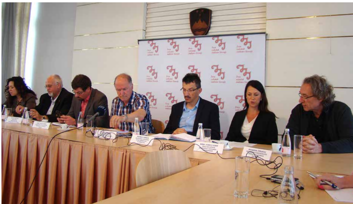
Predsedniki sindikalnih central so odnos do perečih vprašanj večkrat izrazili na novinarskih konferencah

Za informiranje članov uporabljamo tudi družbena omrežja; na Facebooku nam sledi 1800 ljudi, novice objavljamo dnevno, isto na Twitterju, kjer nam sledi 650 ljudi, kar je za slovenske razmere kar lepa številka.