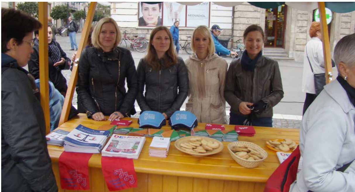
Na plačno vrzel med spoloma smo opozarjali tudi na stojnicah

V sodelovanju z nevladno organizacijo Mirovni Inštitut je ZSSS 10. oktobra 2015 organizirala dogodek z namenom opozarjanja in povečanja ozaveščenosti splošne javnosti o pokojninski in plačni vrzeli med spoloma. Na stojnici na Prešernovem trgu smo mimoidočim razdelili več sto ozaveščevalnih letakov in priročnikov »Enako plačilo za enako delo ali delo enake vrednosti« ter piškotov z manjkajočim delom, ki simbolno predstavlja manjkajoči delež plače oziroma pokojnine, ki jo ženska prejme za enako delo ali delo enake vrednosti v primerjavi z moškimi. Prav tako so obiskovalci prejeli izvod glasila Delavska enotnost, katerega osrednji del je bil posvečen povečanju znanj in dvigu ozaveščenosti o pomembnosti te tematike. Strokovne članke so prispevale strokovnjakinje z Mirovnega inštituta in ZSSS.