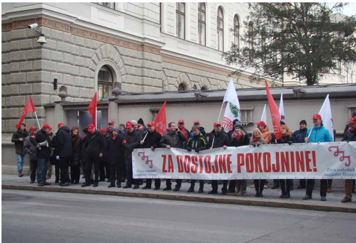
Pred poslopjem vlade smo pokazali, da se ne strinjamo z rešitvami iz Bele knjige o pokojninah

Dne 10. januarja 2017 je bila v Cankarjevem domu v Ljubljani izredna konferenca ZSSS, razširjena s člani organov sindikatov, na kateri so bila sprejeta stališča ZSSS do nekaterih rešitev, vsebovanih v Beli knjigi o pokojninah. Po konferenci se je prek 200 članic in članov sindikatov iz ZSSS odpravilo pred poslopje vlade, kjer je delegacija ZSSS predala stališča do bele knjige v vložišče, saj je z vladne strani nihče ni bil pripravljen sprejeti.