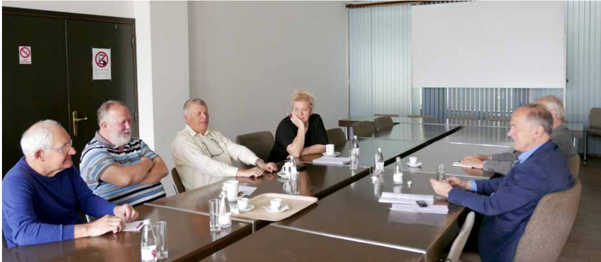
Torkovi jutranji pogovor s predsednikom ZSSS ob kavici je postal tradicija