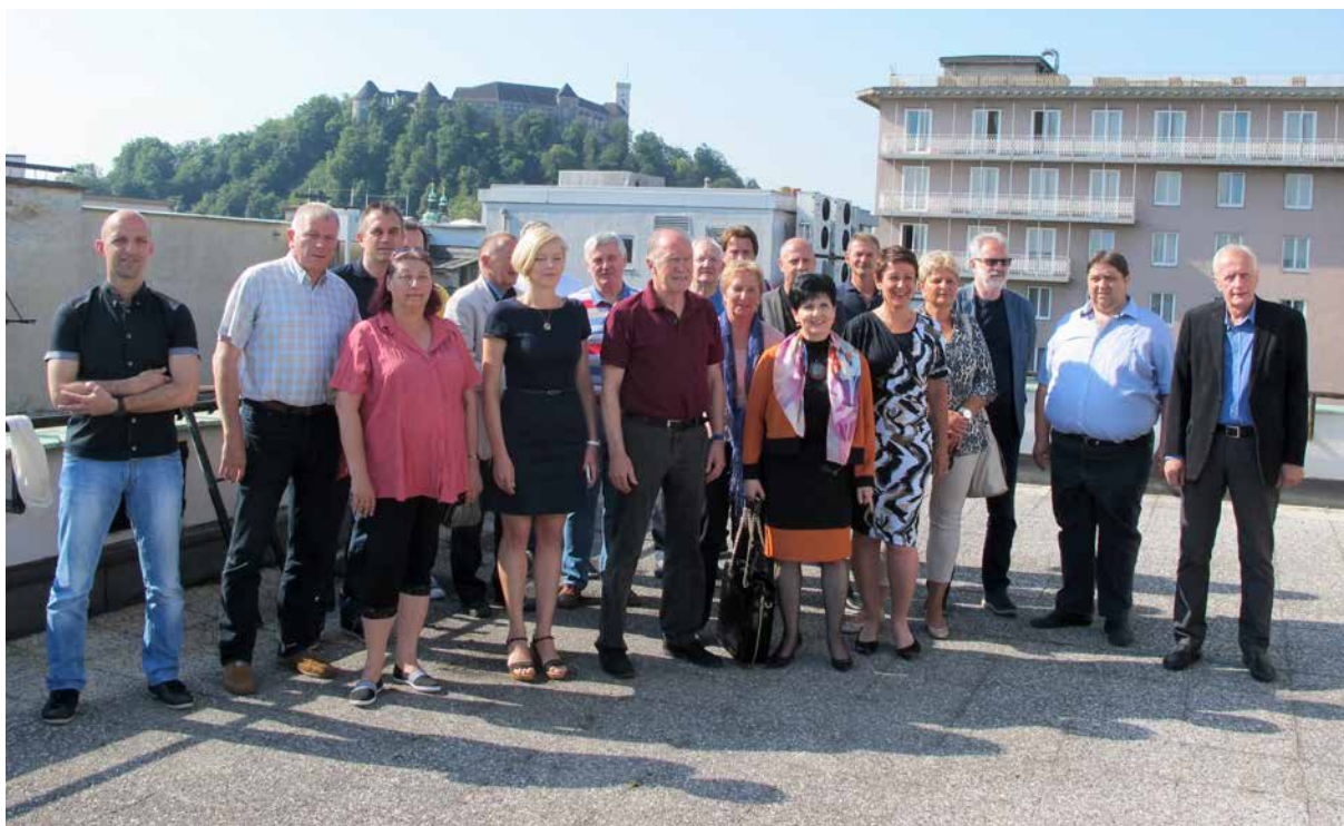
Predsedstvo ZSSS v tem mandatu

ZSSS je imela v obdobju med 6. in 8. kongresom šest sej konference ZSSS, 23 sej predsedstva ZSSS in 36 sej izvršnega odbora ZSSS.